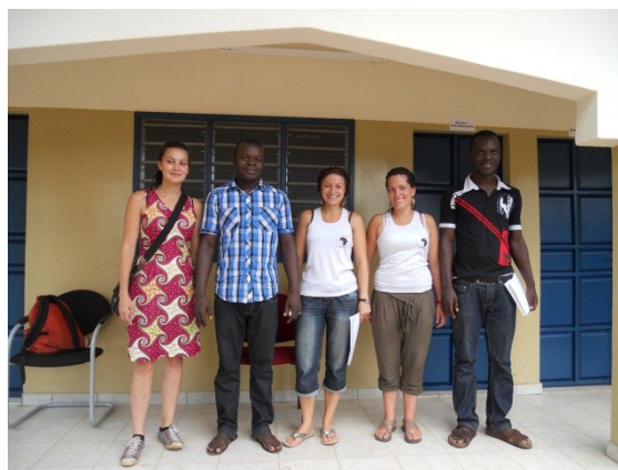
Onze logopedisten met drie stagiaires uit Frankrijk.

Ons rekeningnummer voor giften: 1333 633 76 ten name van Stichting Kinderhulp Togo in Zoetermeer. Wij zijn een ANBI, hetgeen betekent dat uw giften aftrekbaar zijn voor de belastingen. Wilt U ons periodiek (maandelijks bijvoorbeeld) steunen en is uw gift op jaarbasis meer dan € 150,- dan zal de notaris zonder kosten een acte voor U opmaken.