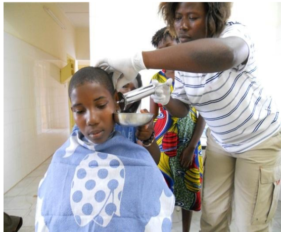
Vaak zitten de oren van Togolese kinderen dicht. Elke maandagmiddag spuiten wij oren uit.

Er komen steeds meer schrijnende gevallen op ons spreekuur. Mensen die geen geld hebben maar wel een triest verhaal. Een voorbeeld: er kwam een meisje bij ons dat een ei had gestolen. In Togo is een ei veel waard. Als straf had de moeder de hand van het meisje een tijdje in het vuur gehouden. Ons Clarafonds – een potje voor arme mensen in hoge nood – betaalde de behandeling van de 2e graads verbranding. Ander voorbeeld: een doofstom meisje komt bij ons met haar moeder. Het meisje is meerdere keren zwanger gemaakt tegen haar wil. Als doofstomme heeft ze geen uitzicht op een baan en haar moeder is arm. Ons Clarafonds betaalt het levensonderhoud van de kinderen. Kosten: € 120,- per maand, voor ons een flinke uitgave maar geheel verantwoord. Klik hier voor andere voorbeelden van hulp. We kunnen wel wat financiële steun gebruiken voor ons Clarafonds.