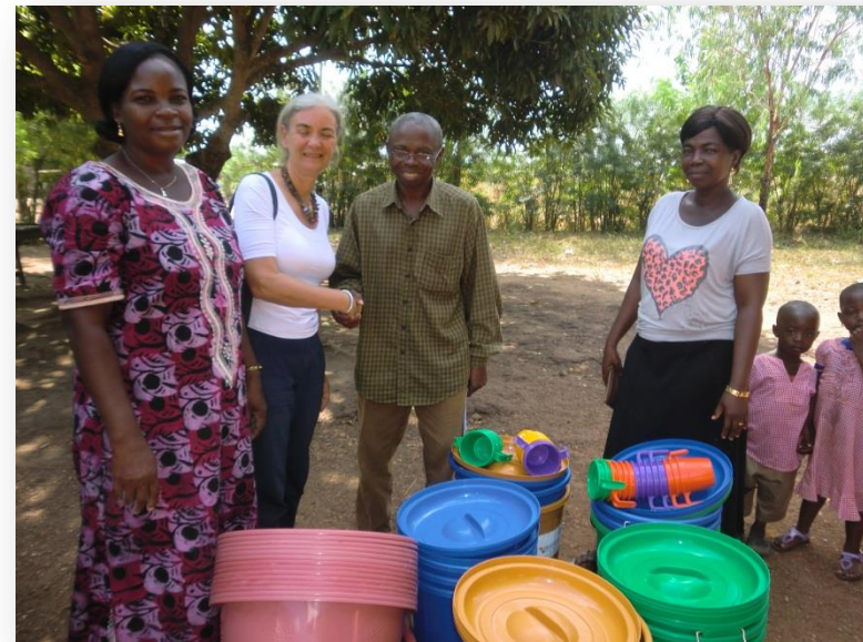
Teiltjes, emmers en zeep voor het handenwasprogramma op de basisscholen