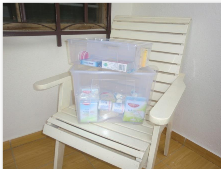
De EHBO-doos (gekocht bij Ikea) die elke school krijgt

teurs en andere geïnteresseerden. In totaal is een dertigtal mensen in min of meerdere mate regelmatig actief voor dit project en enkele tientallen op ad-hoc basis.