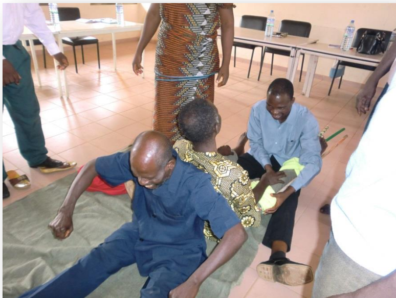
Oefenen tijdens de EHBO-cursus voor onderwijzers

len in de regio Kpalimé in te voeren 6 . En vervolgens heeft de Drieëenheidsparochie c.s. samen met Vastenactie geld bijeen gehaald om in het jaar 2014 op 36 basisscholen dit handenwas-