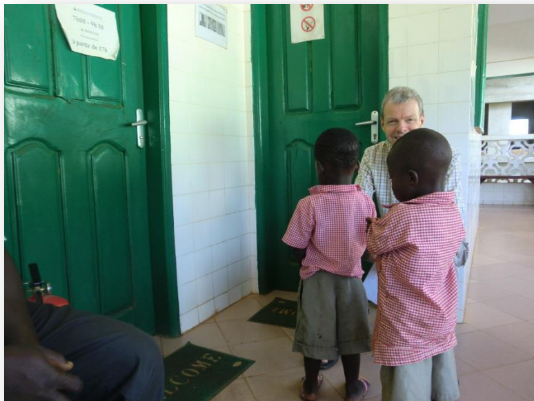
Twee kleuters voor de deur van het laboratorium (Sotouboua)

Na diverse gesprekken zijn wij tot de conclusie gekomen dat deze stichting en het achterliggende bedrijf een goede partner kunnen zijn voor ons werk in Togo. Als de samenwerking goed loopt, zou de Togolese stichting op termijn misschien onze acti-