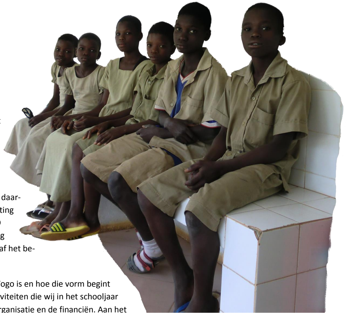
Kinderen wachten tot ze onderzocht worden (Sotouboua)

In dit jaarverslag leggen wij allereerst uit wat onze missie in Togo is en hoe die vorm begint te krijgen in het land. Vervolgens doen wij verslag van de activiteiten die wij in het schooljaar 2013-2014 hebben ondernomen. Tot slot gaan wij in op de organisatie en de financiën. Aan het eind volgt nog een aantal bijlagen met specifieke gegevens waaronder de verkorte jaarrekening.