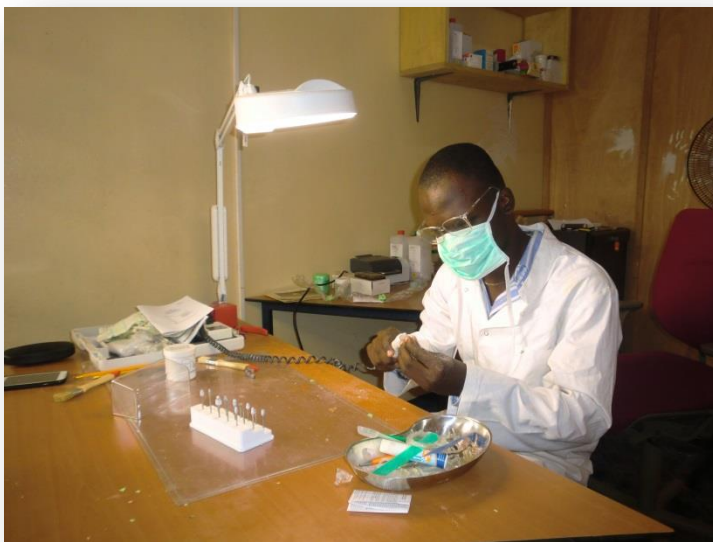
Onze audicien maakt een oorstukje op maat

Wij hebben deze aanbevelingen voor ons werk in Togo in vijf pijlers opgedeeld (zie voor details onze website 1 ), te weten: