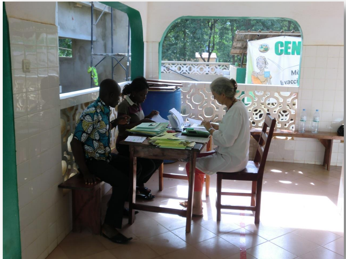
Dossiers bespreken tijdens pilot Sotouboua

(©) Stichting kinderpulp Togo, oktober 2014 Stichting Kinderhulp Togo Bijdorplan 60 2713 RR Zoetermeer j.j.schat@kinderhulp-togo.nl tel: 06-55 747 045 (Jouke Schat) Kamer van Koophandel 27314147 Rekeningnummer NL83 RABO 0133 3633 76 Rabobank Zoetermeer