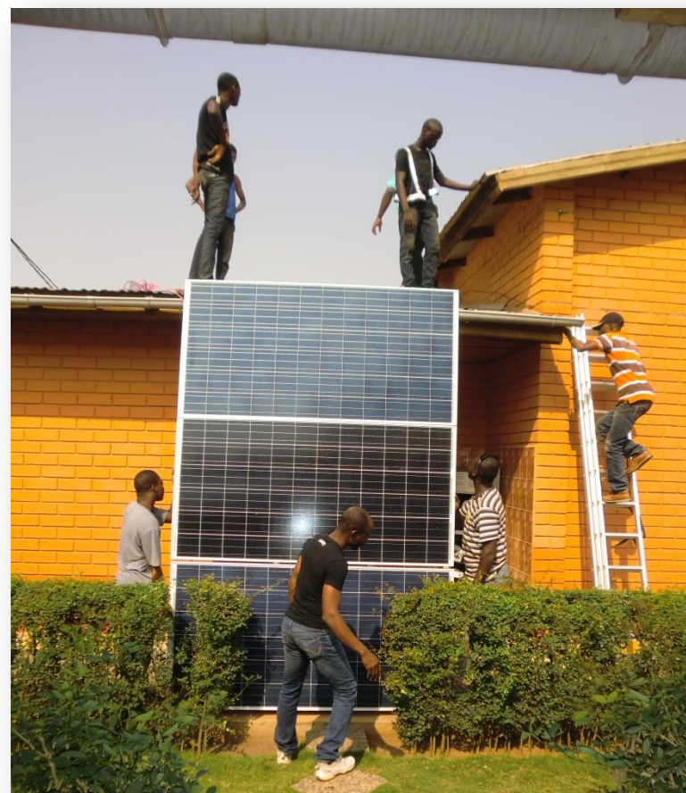
Dankzij een Nederlandse goede-doelinstichting hebben wij nu zonnepanelen op ons centrum (hoera!)