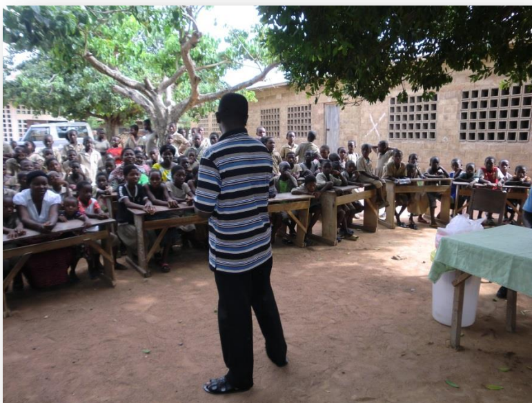
Voorlichting op school

Langs verschillende wegen dragen wij onze kennis over voeding en gezondheid over aan de plaatselijke bevolking. Bijna niemand heeft televisie en hetzelfde geldt voor internet. Kranten en tijdschriften zijn er in Kpalimé niet, niemand zou die trouwens kunnen betalen. Daarom is de radio een heel belangrijk medium.