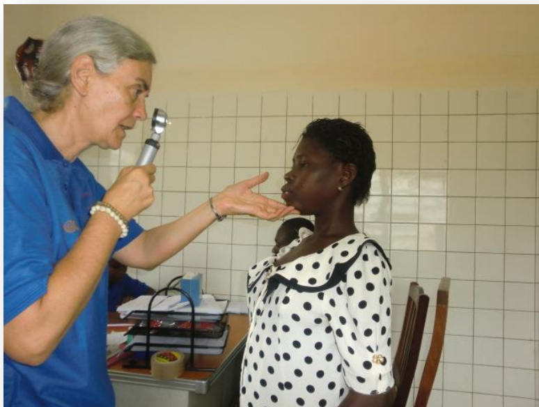
Onderzoek van een kind met microcefalie (kleine herseninhoud)

deren opvoeden. Maar die is ook arm want pensioen en bijstand zijn er niet in Togo.