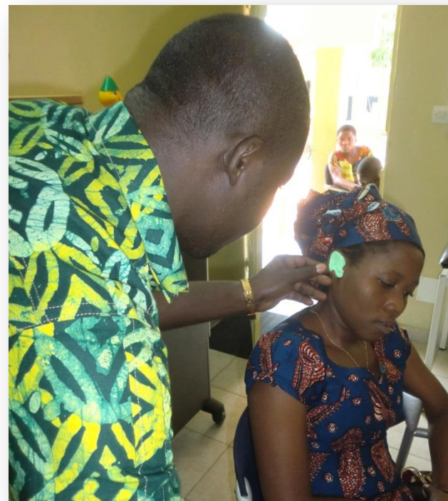
Om een oorstukje te maken moet eerst een afdruk van het oor worden gemaakt