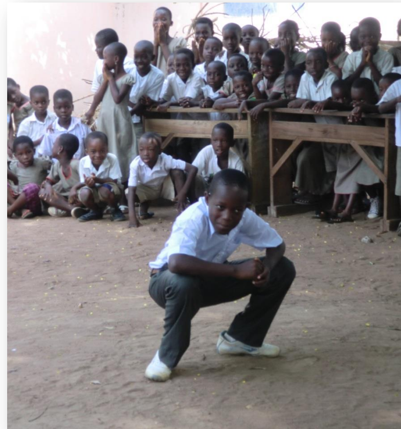
Toneelstukje tijdens de opening van de toiletten op de basisschool Christ-Roi

Tot slot geven wij per jaar tientallen presentaties in het land over ons werk. Bij serviceclubs zoals Rotary, aan kerken, ondernemersorganisaties, in bejaardentehuizen en waar dat verder ook maar wordt gevraagd. De belangrijkste presentaties in PowerPoint zijn te vinden op onze website.