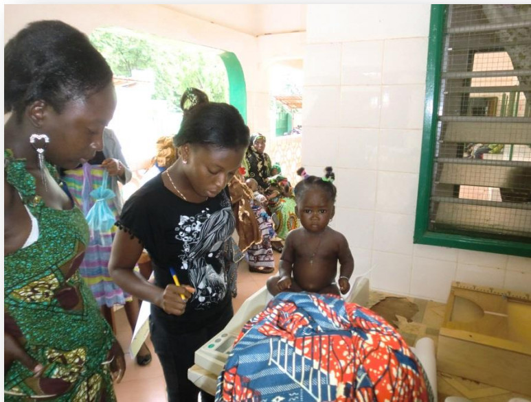
Gewichtscntrole baby door onze assistente (pilot Sotouboua)

rium en het vervoer) en verder voor onze collectieve projecten, waarover wij elders in dit jaarverslag berichten.