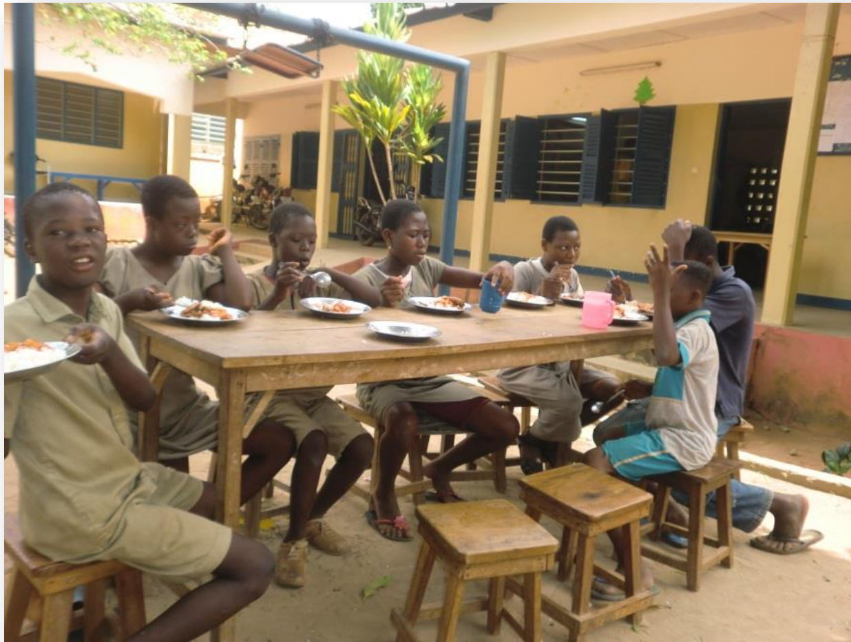
De kinderen van de gehandicaptenschool Envol krijgen middageten dankzij ons speciale programma

1 september). Van half juli tot eind augustus is ons centrum echter dicht.