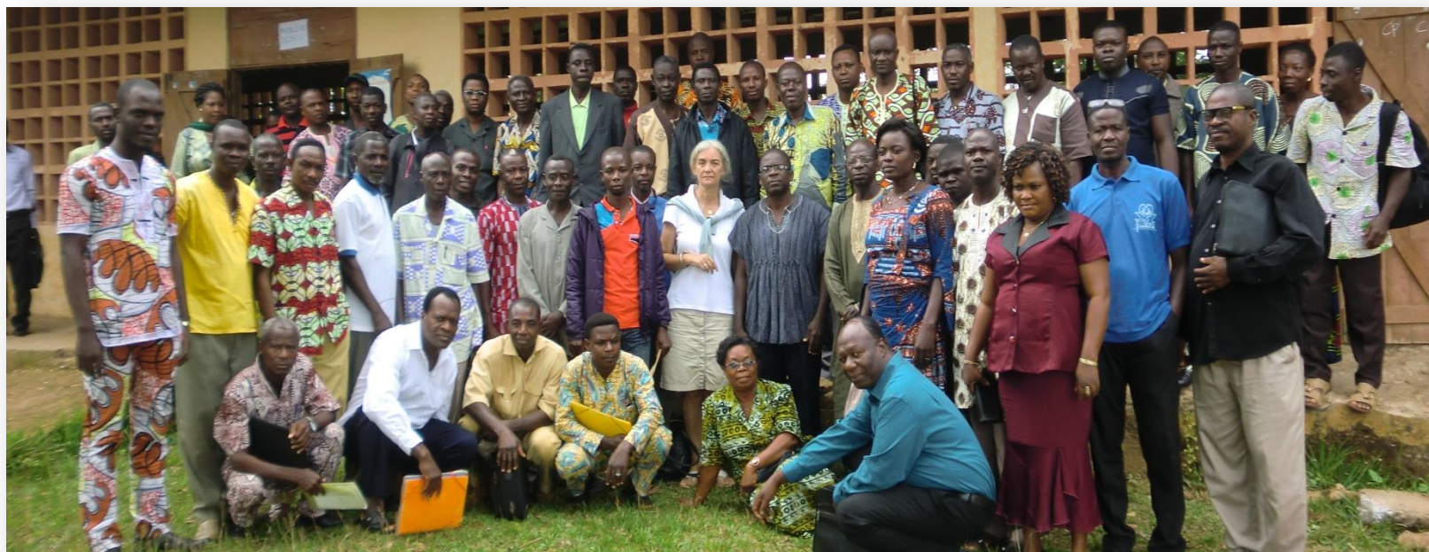
Een groep van onderwijzers die wij hebben geschoold