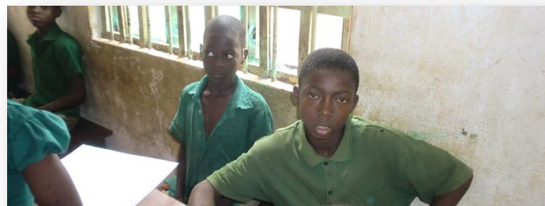
Eén van de kinderen van de dovenschool met twee gehoorapparaten

In het jaar 2011 kregen wij een forse gift om sikkelcelanemie te bestrijden. Dit is de grootste erfelijke ziekte ter wereld met meer dan 100 miljoen mensen die eraan lijden. Maar de ziekte komt niet voor bij blanken en is daarom bij ons minder bekend. In Togo lijdt bijna 25% van de mensen aan deze ziekte, die in de ernstigste vorm - 4% van de kinderen heeft die - uiteindelijk de dood ten gevolge kan hebben. Het is een ziekte waarbij de rode bloedlichaampjes gaan klonteren en de milt wordt aangetast. Daardoor wordt het afweersysteem van het lichaam ernstig verzwakt.