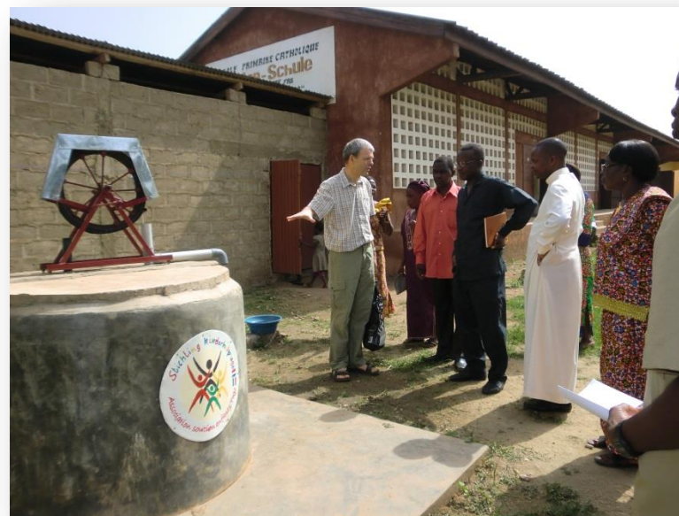
Inspectie van de waterput op de school Christ-Roi door hoogwaardigheidsbekleders op de openingsdag

De overige uitgaven - naast personeelskosten - zijn voor het functioneren van het centrum (o.a. de kosten van het laborato-