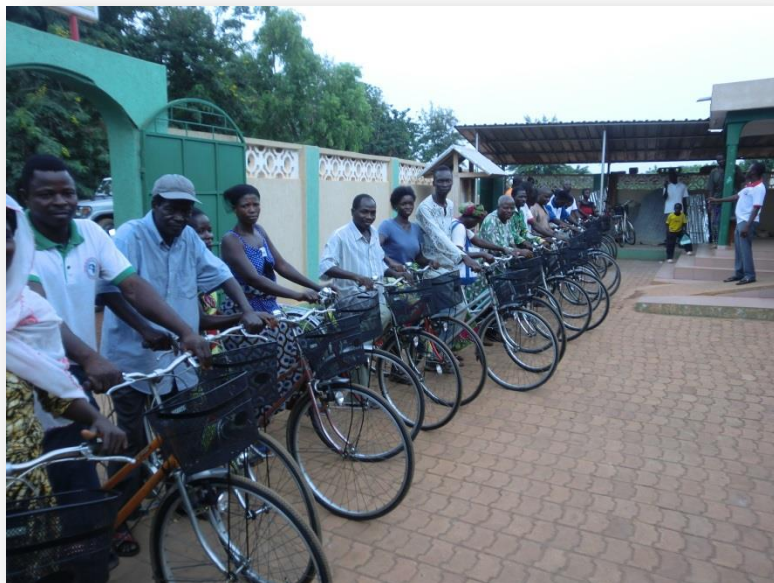
Met hulp van een goede doelinstichting uit Nederland hebben 20 gezondheidsassistenten in Sotouboua een fiets gekregen. Zij doen hun werk gratis.

de Togolese overheid op 1 oktober 2010 onder nummer 382/PR/MPDAT/2010, getekend namens de president door de minister van Planning, Ontwikkeling en Ruimtelijke Ordening. Dit programma is eind 2013 voor drie jaar verlengd.