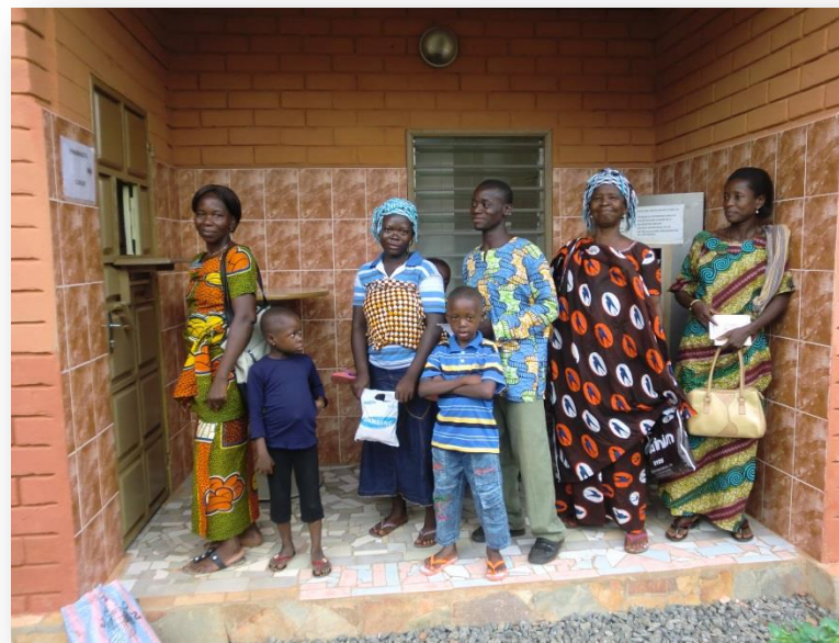
In de rij om te betalen aan de kassa

Voorkomen van ziektes heeft in Togo veel te maken met een betere hygiëne. Daarvoor is nodig dat kinderen hun handen kunnen wassen vóór het eten en na de toiletgang. Er is dus water uit de kraan of uit een put nodig, thuis en op school. En natuurlijk zijn toiletten hard nodig. Dat alles ontbreekt meestal. Wij proberen te helpen door waterputten en toiletten te bouwen, als we het geld daarvoor bijeen kunnen brengen. Dat valt niet mee want de kosten voor solide putten en toiletten zijn hoog: rond