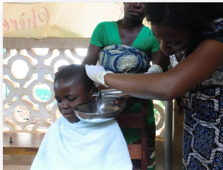
Oren uitspuiten door twee van onze assistentes

Omdat er geen algemene ziektekostenverzekering in Togo is, lopen de kinderen met hun klachten door tot ze zo ziek zijn geworden dat het echt niet verder kan. Is er dan geen geld in de familie, dan sterft het kind meestal. Als de familie wel hutje bij mutje heeft gelegd, gaat het kind naar het ziekenhuis. Vaak is de zaak dan al zo ernstig dat het veel moeite kost om de ziekte te genezen en soms gaat het helemaal niet meer (bijvoorbeeld: te ver voortgeschreden glaucoom; het kind wordt blind). Voorkomen is beter dan genezen, maar er moet wel een genezer zijn en ook geld om de behandeling te betalen. Ons centrum vervult hier een belangrijke rol.