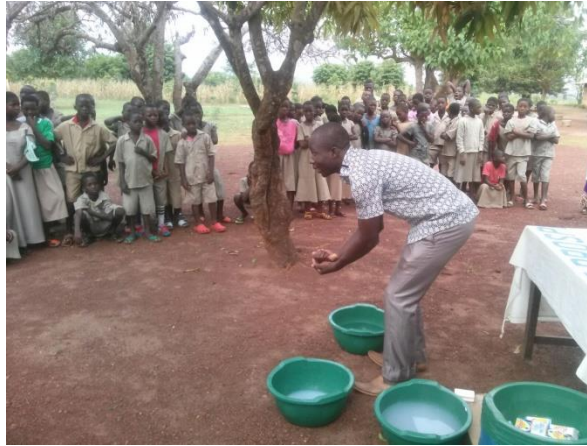
Instructie over goed handen wassen.

naar hun speciale school ("Vivenda" resp. "Envol") te kunnen komen loopt nog maximaal twee jaar door. In die tijd krijgen kinderen met een dergelijke handicap die ver van de school wonen, een vergoeding voor de (motor)taxikosten en ook krijgen zij op school een warme maaltijd aangeboden om op die manier de hele dag op school te kunnen blijven. Met dit programma helpen wij tientallen kinderen om aangepast onderwijs te kunnen krijgen, ook al wonen ze ver van school en zijn hun ouders vaak arm (gebroken gezinnen). Ook voorziet het programma in subsidiering van medische kosten voor de kinderen. Daarmee krijgen deze kinderen een goed kans op aangepast en goed onderwijs. Intussen kijken wij al verder, naar het moment