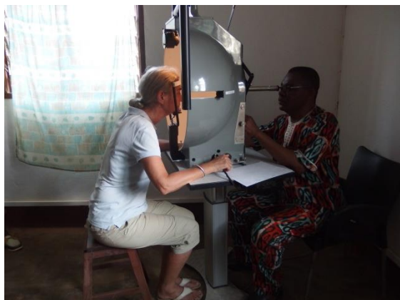
Onderzoek gezichtsveld met behulp van een perimeter, gefinancierd door Nederlandse goede-doelenstichting.

In stilte maar in de regio's Kpalimé en Sotouboua bepaald niet onopgemerkt gaat ons fonds voor de allerarmsten onvermoeibaar door. Na de zomer komen wij met de verantwoording over het schooljaar 2015-2016 maar nu al kunnen we zeggen dat het weer topdrukte is geweest bij dit fonds. We zijn vaak financieel bijgesprongen bij kinderen met gehoorproblemen maar ook bij kinderen met epilepsie. We hebben operaties meegefinancierd van relatief eenvoudige problemen zoals navel –en liesbreuk maar ook van gecompliceerdere zaken als open verhemelte en zelfs hartkwalen. En er ging weer veel geld naar slechthorende kinderen en kinderen met een verstandelijke beperking om hen naar de speciale scholen te laten gaan. Klik hier voor de resultaten van het schooljaar 2014-2015.