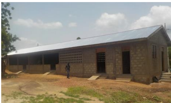
De nieuwe school voor dove en slechthorende kinderen.