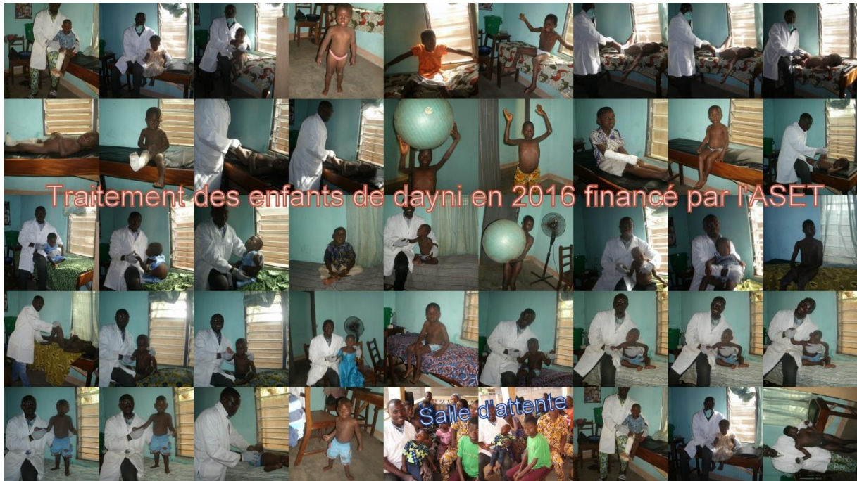
Collage orthopedische problemen fysiotherapeut.