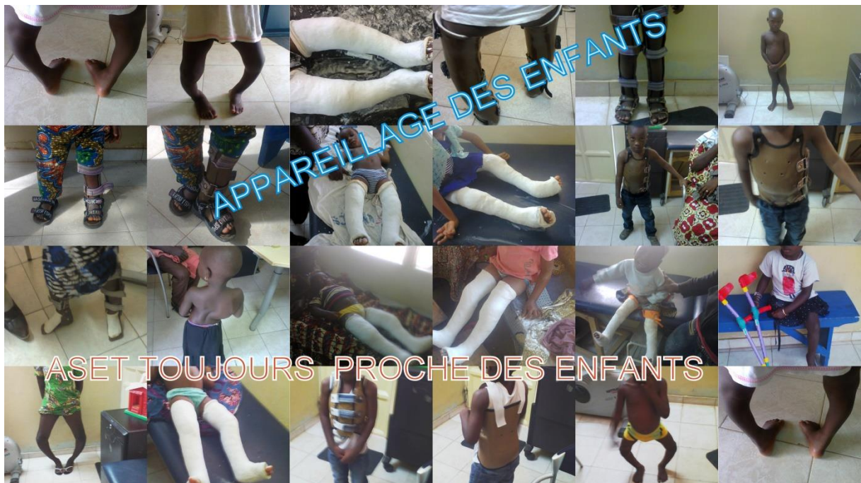
Collage orthopedische problemen fysiotherapeut.