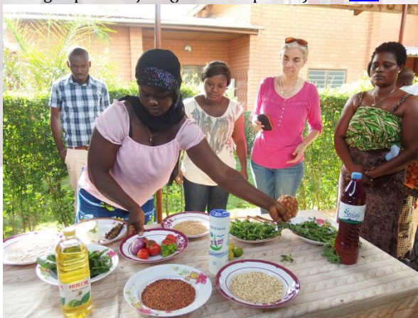
Cursus voeding voor moeders: zelf een gezonde maaltijd samenstellen met producten van de markt.

een paar in het oog springende voorbeelden te noemen. En ze gebruiken te veel (verzadigde) palmolie en zout (bloeddruk). Daar is met heel eenvoudige middelen wat aan te doen. Wij hebben een cursus ontwikkeld waarbij we met theorie- en praktijklessen aantonen dat je ook met minder zout en minder vet heel smakelijk kunt koken. En we geven tips over het gebruik van ingrediënten die de vrouwen niet kennen maar die hun maaltijden enorm verrijken en die goedkoop zijn zoals de bladeren van de moringaboom, parelgierst, spiruline en soja. De volgende stap is dat wij onderwijzers gaan scholen en de vrouwen die op school in de pauzes eten verkopen. En tot