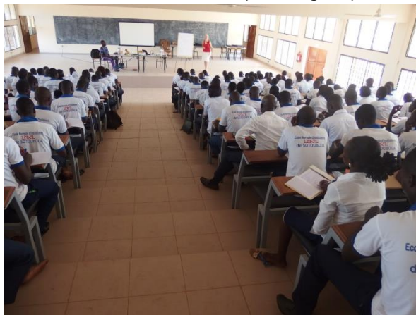
Les geven op de PABO in Sotouboua.

eind januari 2016 afgelopen, omdat we daar alle in aanmerking komende kinderen hebben onderzocht. In Sotouboua waar we pas veel later konden beginnen vanwege het aanvankelijk ontbreken van een tandarts, gaat het project nog enige tijd door. De resultaten van Kpalimé zijn als volgt. Wij hebben daar aan ongeveer 6000 kinderen