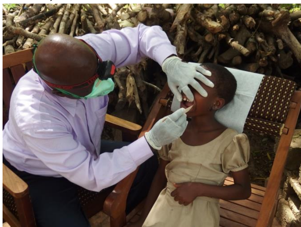
Onze tandarts in Kpalimé onderzoekt de gebitten op het schoolplein.

Van 25 tot 28 januari 2016 hebben wij in de stad van ons tweede centrum Sotouboua een cursus gegeven aan 45 onderwijzers in het basisonderwijs. De cursus heeft tot doel hen te leren dat er spraak/taalproblemen bestaan, deze problemen te onderkennen en daarop de juiste actie