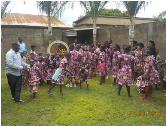
Een deel van de 79 ontheemde kinderen in de tuin van ons centrum in Kpalimé.

Wij publiceerden in juni de verkorte jaarrekening 2015 van onze Nederlandse en Franse stichtingen (klik hier ). Voor grotere donateurs en institutionele sponsors is de uitgebreide jaarrekening op verzoek beschikbaar.