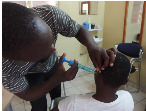
Onze logopedist/audicien maakt oorafdruk om daarna oorstukje te maken (voor gehoorapparaat).

Die putten zijn door het steeds droger worden van het klimaat in de regio in de droge tijd niet diep genoeg meer om water te kunnen onttrekken. De meeste inwoners van de stad leven van water uit een waterput. Maar weinig mensen kunnen zich de kosten van aansluiting op het openbare waternet veroorloven. Hopelijk kunnen de mensen met deze verdiepingsslag weer een aantal jaren